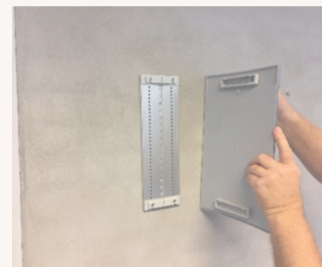
4. Skiltet tages af.