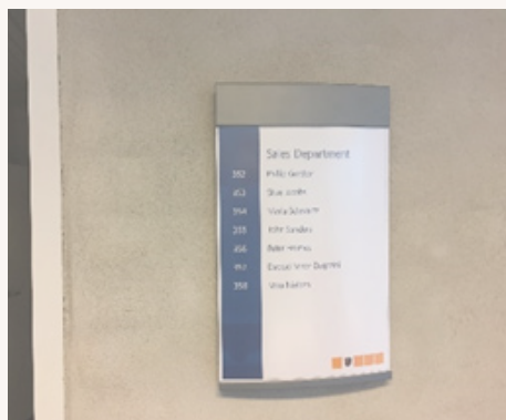
1. Opsat skilt.