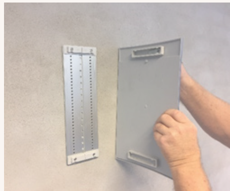
2. Skilt sættes på bagplade.