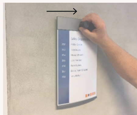
3. Låsen frigøres fra skiltepladen og skiltet skydes til side.