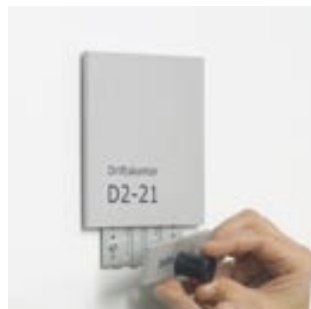
PlanSign magnetlåsesystem Det låste skilt frigøres ved brug af magnetnøglen