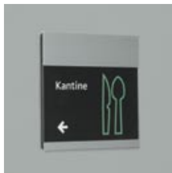
A5 paperflex skilt