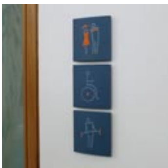
Vægskilte med pictogrammer

Let at montere. Skiltet skydes på monteringsbeslaget og er fastlåst, så det ikke kan fjernes af uvedkommende. Det frigøres igen ved brug af magnetnøglen.