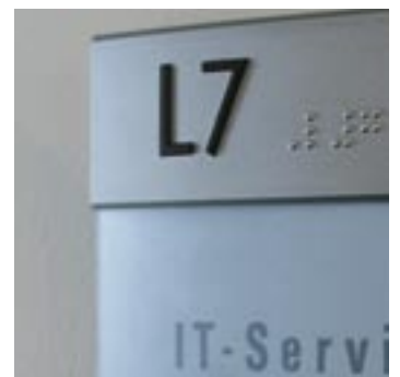
Paperflex skilt med blindskrift